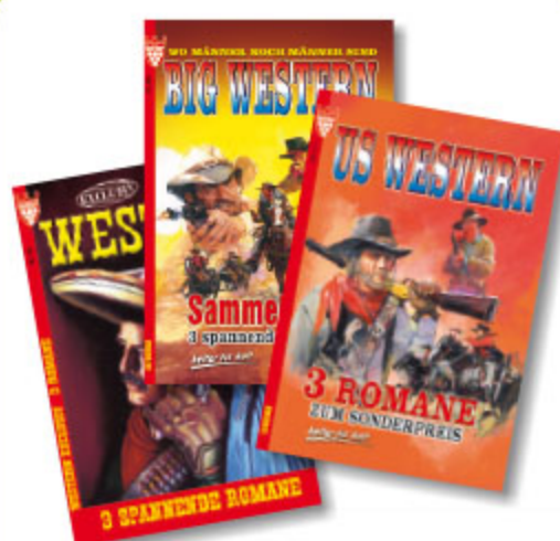
3er Roman Western, sortiert, ca. DIN A5, 192 Seiten Art.-Nr. 82003 / VE 20