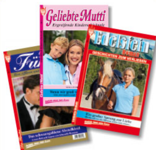
1er Roman Liebe, sortiert, ca. DIN A5, 64 Seiten Art.-Nr. 80000 VE 100