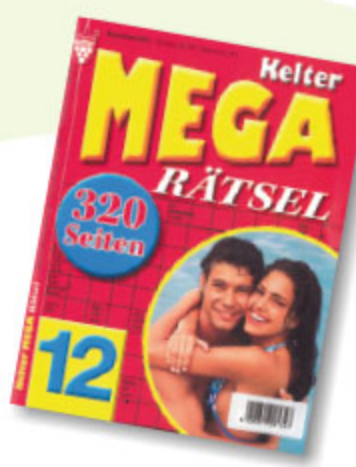
großes Rätselbuch, sortiert, ca. DIN A4 Art.-Nr. 86090 VE 10