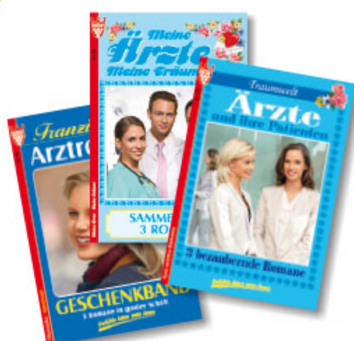
3er Roman Arzt, sortiert, ca. DIN A5, 192 Seiten Art.-Nr. 82004 VE 20