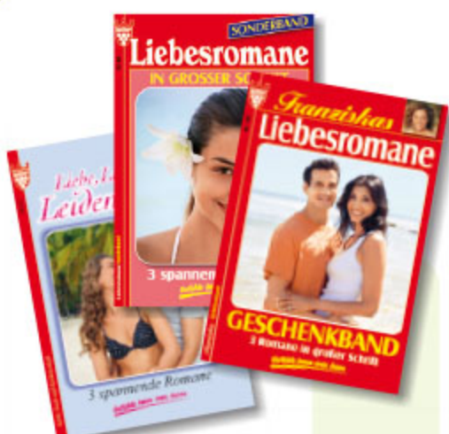
3er Roman Liebe, sortiert, ca. DIN A5, 192 Seiten Art.-Nr. 82001 VE 20