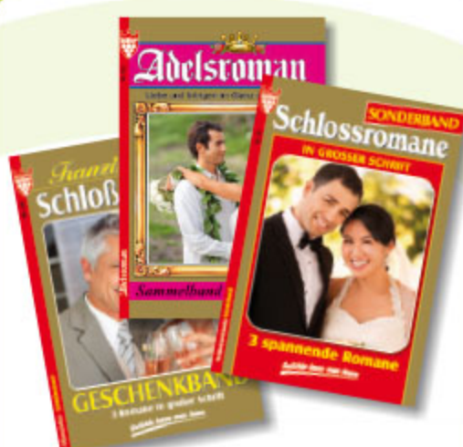
3er Roman Adel, sortiert, ca. DIN A5, 192 Seiten Art.-Nr. 82006 VE 20