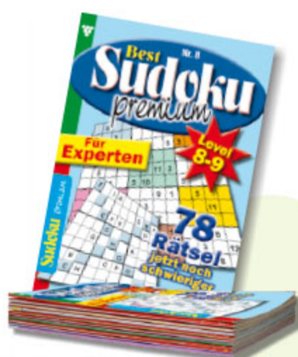
10x 1er Sudoku im Pack sortiert Art.-Nr. 86018 VE 10