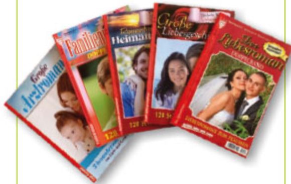
2er Roman, sortiert Art.-Nr. 81001 VE 100