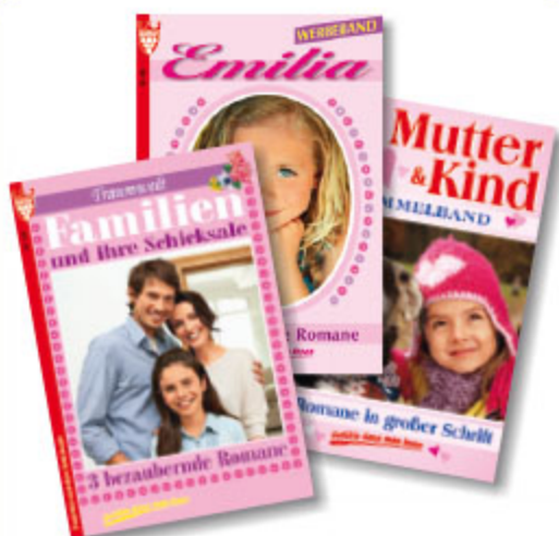
3er Roman Familie, sortiert, ca. DIN A5, 192 Seiten Art.-Nr. 82007 VE 20