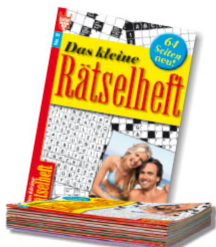
10x 1er Rätsel im Pack, sortiert Art.-Nr. 86050 VE 10