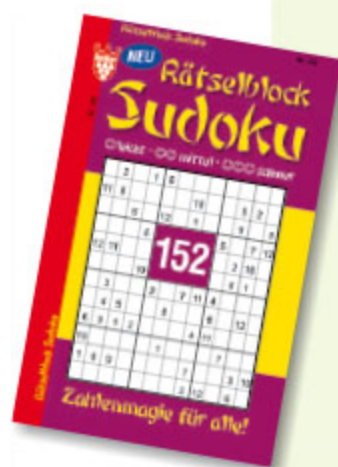
Sudokublock, sortiert, ca. DIN A5 Art.-Nr. 86084 VE 20