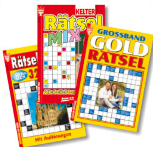
5er Rätsel, sortiert, ca. DIN A5, 320 Seiten Art.-Nr. 86012 VE 20