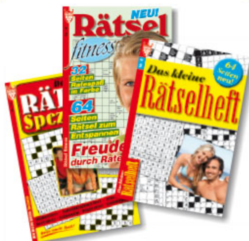
1er Rätsel, sortiert ca. DIN A5, 64 Seiten Art.-Nr. 86000 VE 100