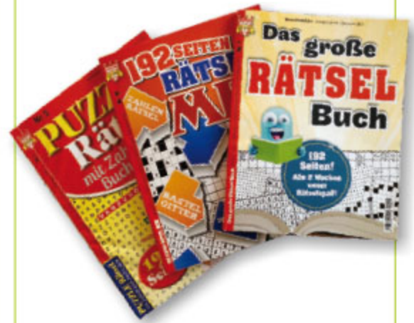
großes Rätselheft, DIN A4, 192 Seiten, Art.-Nr. 86140 / VE 20