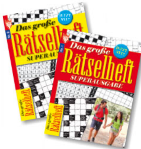
großes Rätselheft, ca. DIN A4, 64 Seiten, Art.-Nr. 86127 / VE 50