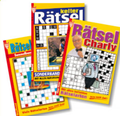
3er Rätsel, sortiert, ca. DIN A5, 192 Seiten Art.-Nr. 86010 VE 20