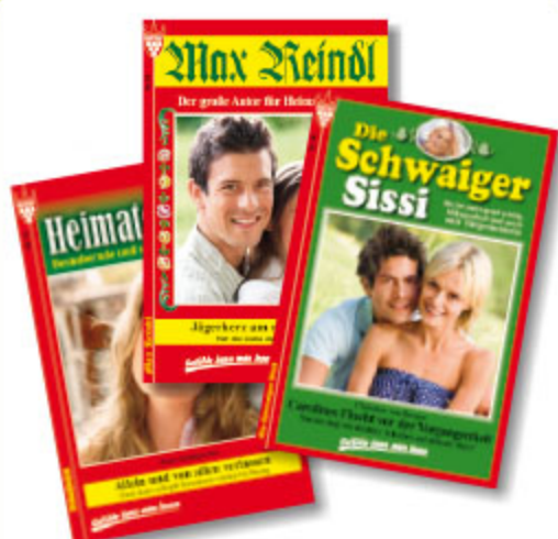
1er Roman Heimat, sortiert, ca. DIN A5, 64 Seiten Art.-Nr. 80004 VE 100