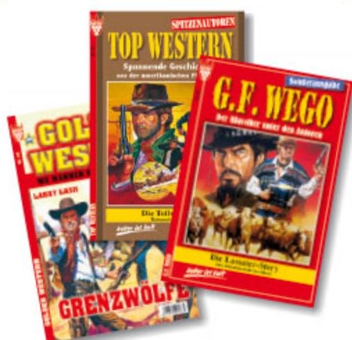
1er Roman Western, sortiert, ca. DIN A5, 64 Seiten Art.-Nr. 80002 / VE 100